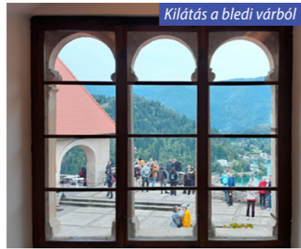
Kilátás a bledi várból