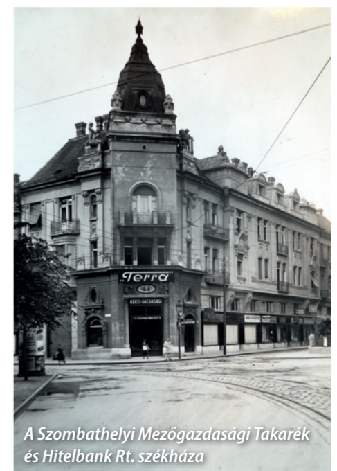
A Szombathelyi Mezőgazdasági Takarékszövetkezet és Hitelbank Rt. székháza