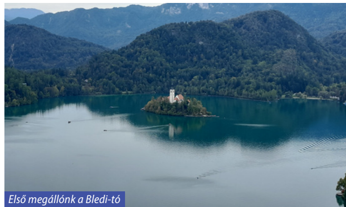
Első megállónk a Bledi-tó