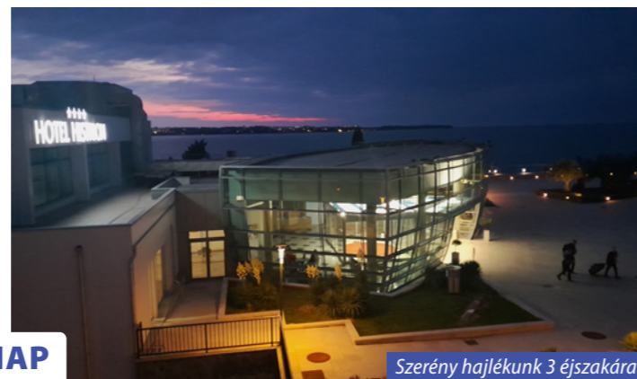
Szerény hajlékunk 3 éjszakára