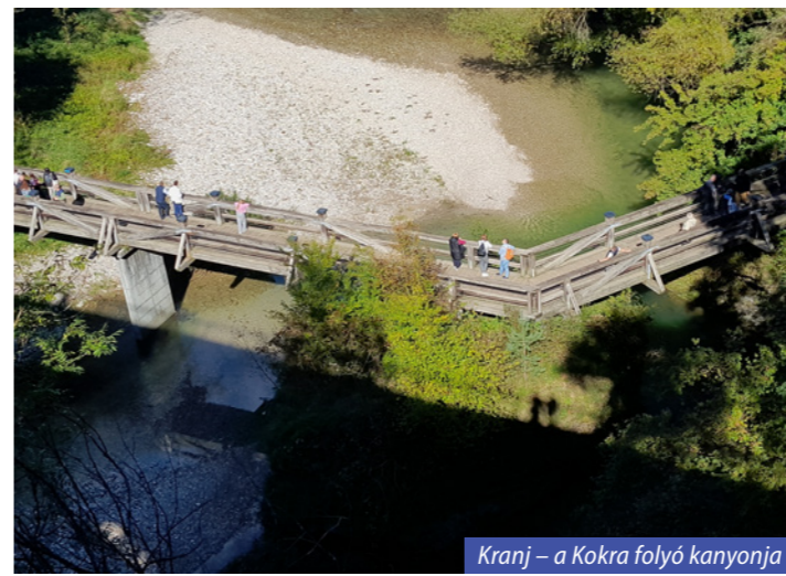
Kranj – a Kokra folyó kanyonja