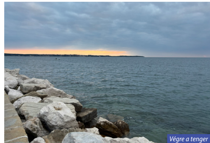
Végre a tenger