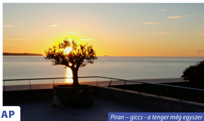
Piran – giccs - a tenger még egyszer