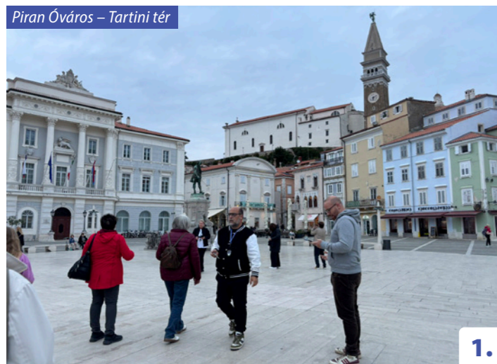
Piran Óváros – Tartini tér