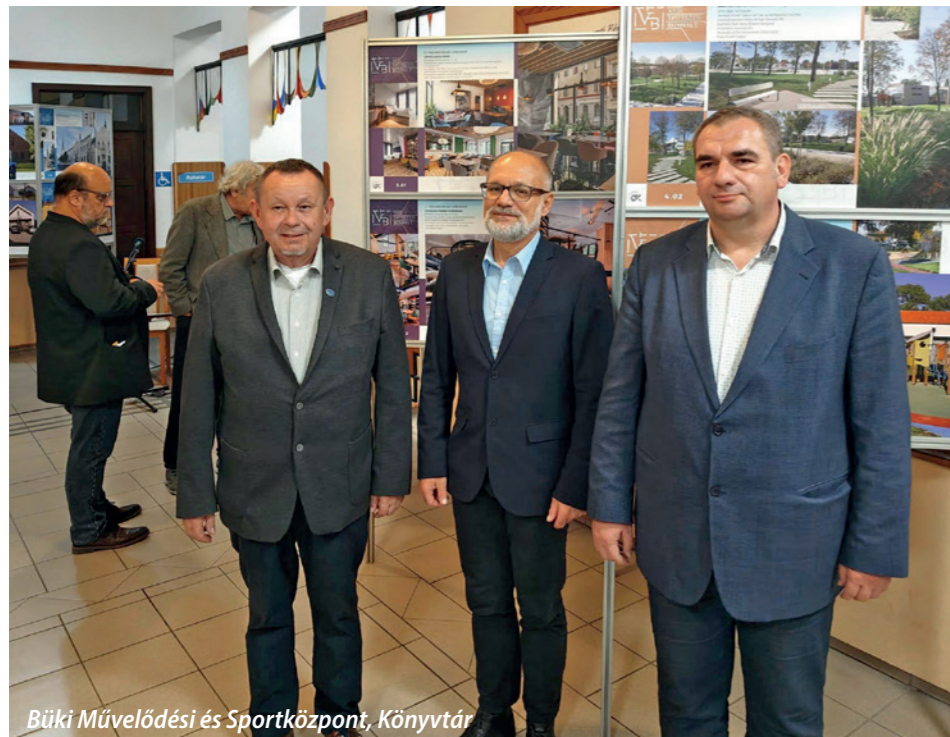
Büki Művelődési és Sportközpont, Könyvtár

zett nagyszabású kiállításon pavilonunkat a 2024-es biennálé anyagából válogatott tablók díszítették. November elején a Büki Művelődési és Sportközpont színháztermének előterében szerepelt kollekciónk, majd a répcelaki Répce Sportcsarnok előcsarnokába utazott a vándorkiállítás.