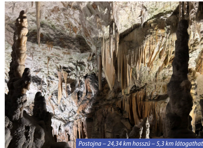
Postojna – 24,34 km hosszú – 5,3 km látogatható