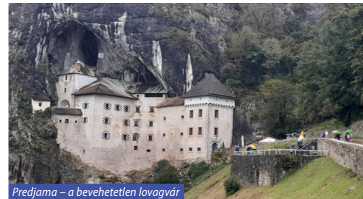
Predjama – a bevezetetlen lovagvár