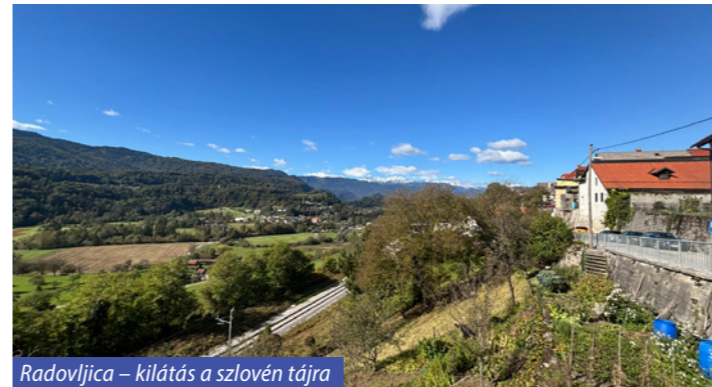
Radovljica – kilátás a szlovén tájra