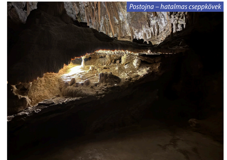
Postojna – hatalmas cseppkövek