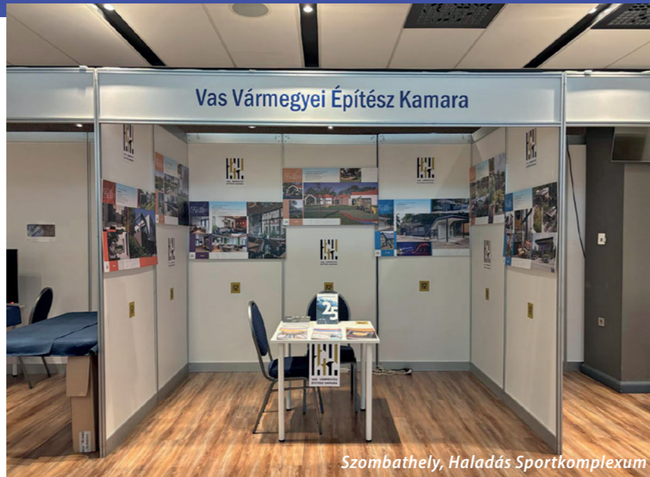
Szombathely, Haladás Sportkomplexum

Nagy népszerűsége van kamaránkban a Vasi Építészeti Biennálénak, melyen kamarai tagjaink jelentősebb munkáit tárjuk a nagyközönség elé. Ezen az eseményen két évente lehetőségünk nyílik arra, hogy együtt lássuk azokat a jelentősebb alkotói munkákat, amelyet kamaránk tagjai az elmúlt időszakban létrehoztak.