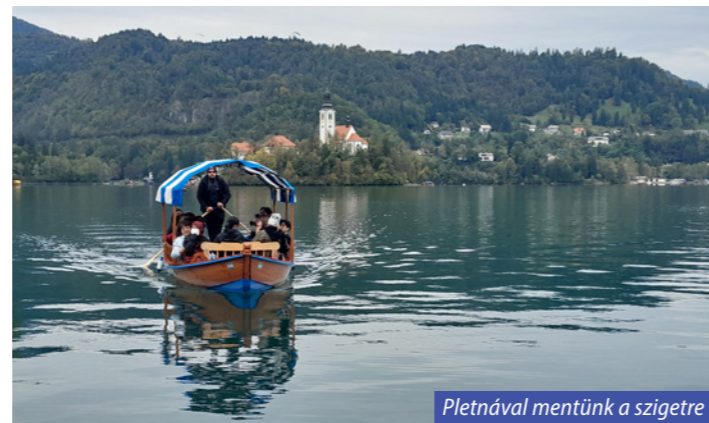
Pletnával mentünk a szigetre