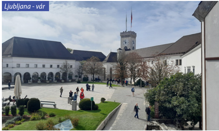
Ljubljana - vár