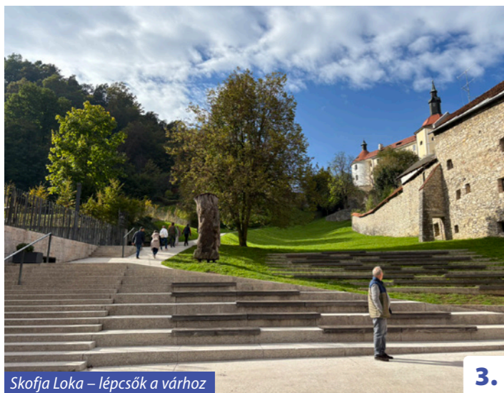
Skofja Loka – lépcsők a várhoz