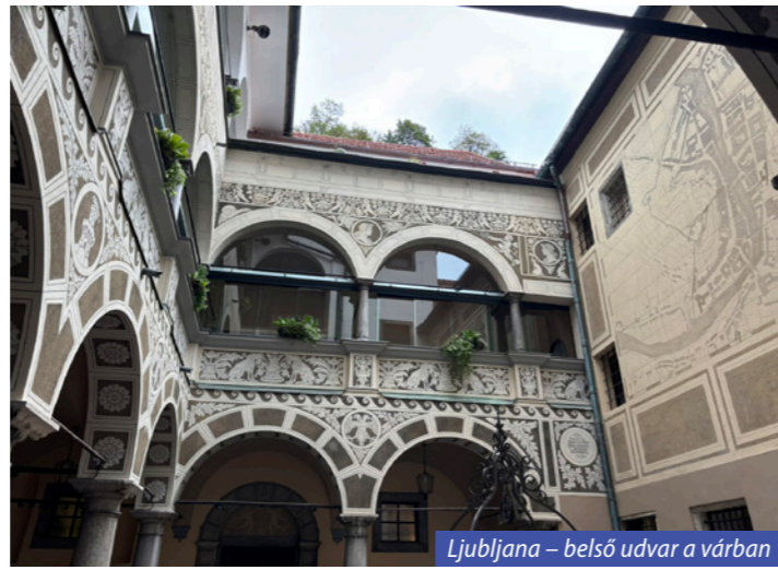
Ljubljana – belső udvar a várban