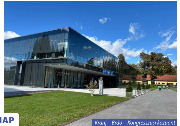
Kranj – Brdo – Kongresszusi központ