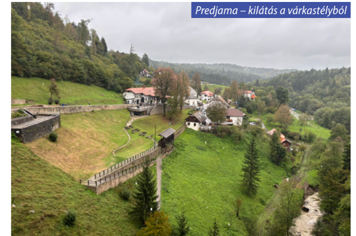
Predjama – kilátás a várkastélyból