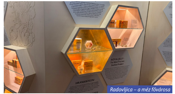
Radovljica – a méz fővárosa