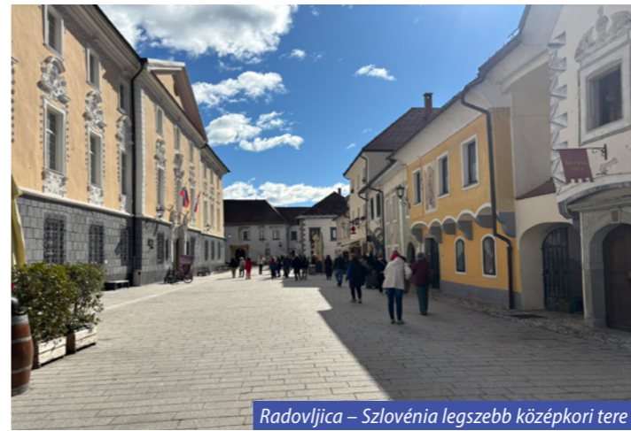
Radovljica – Szlovénia legszebb középkori tere