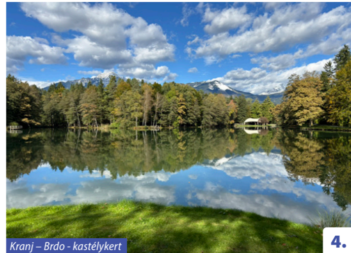
Kranj – Brdo - kastélykert