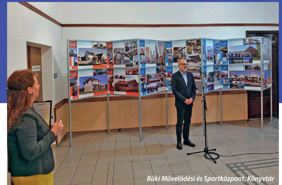
Büki Művelődési és Sportközpont, Könyvtár

A Vasi Építészeti Biennálét 2024-ben is megszerveztük, 2025-ben a válogatás Vas Vármegye területén vándorútra indult. Év elején a kőszegi Hotel Írottókó adott otthont a gyűjteménynek. A szálloda előcsarnokában több, mint egy hónapig tartott a kiállítás, a visszajelzések szerint a látogatók nagy öröme. Szeptember végén a Vas Vármegyei Kereskedelmi és Iparkamara felkérte kamaránkat, hogy az általuk szervezett ÖKO-EXPO Szombathely elnevezésű, háromnapos rendezvényén vegyünk részt. A Haladás Sportkomplexumban megrende-