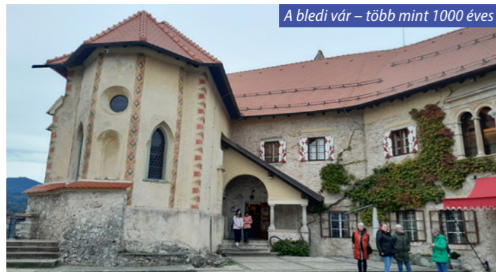
A bledi vár – több mint 1000 éves