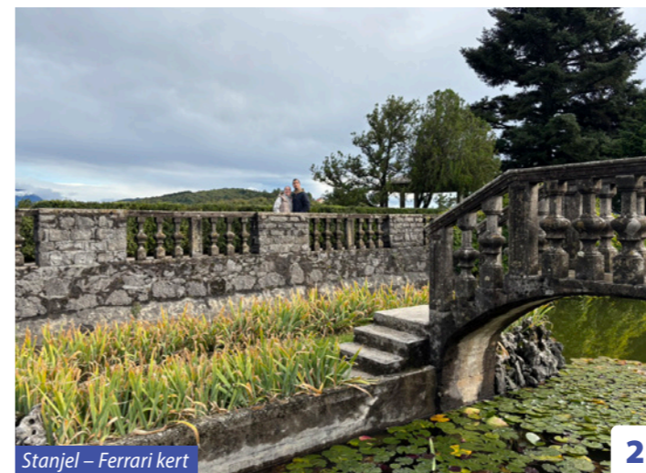
Stanjel – Ferrari kert