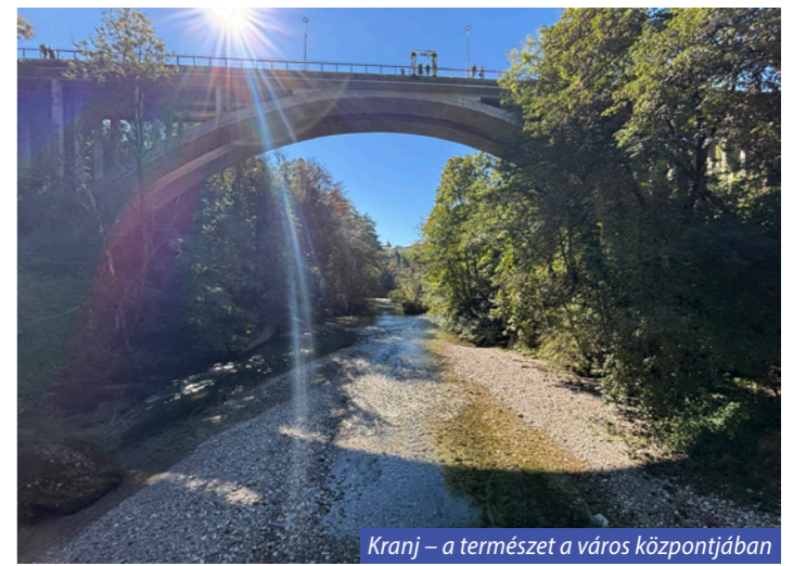
Kranj – a természet a város központjában