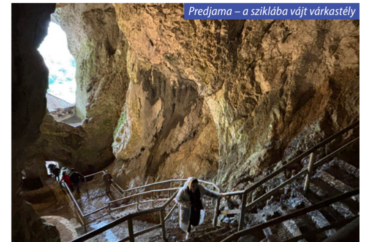
Predjama – a sziklába vájt várkastély