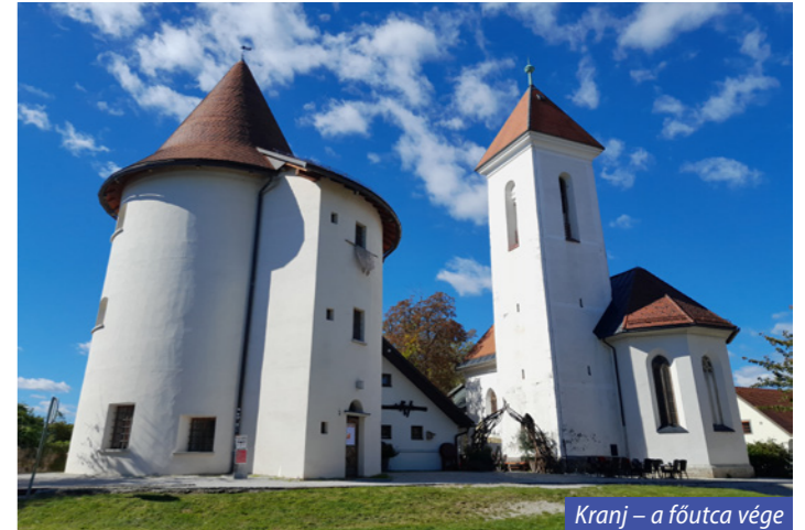
Kranj – a főutca vége