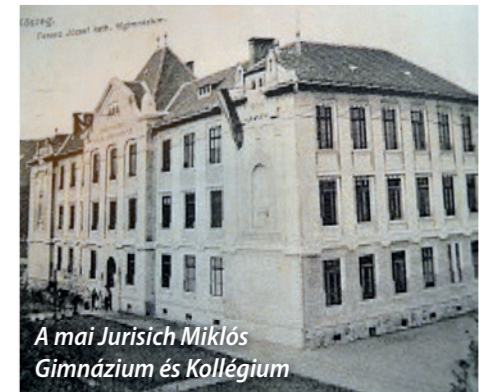
A mai Jurisich Miklós Gimnázium és Kollégium

letek – lakóépületek – sportlétesítmények – egyéb munkák – csoportosításban mutatja be az egyes épületeket hosszabb – rövidebb leírással, adatokkal és többnyire színes fényképekkel. Majd a „mellékletek” következnek, ahol Hajós írásából kapunk válogatást: a Pesti Napló, a Sport-világ, Sporthírlap, a Tér és Forma stb. hasábjain láttak napvilágot egykor. A magánkiadásban megjelent, szép kiállítású kötetet az irodalomjegyzék és névmutató zárja.