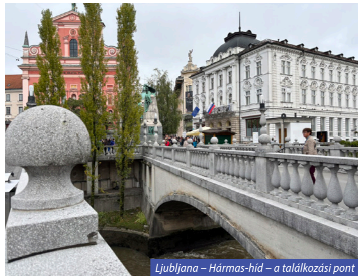
Ljubljana – Hármashíd – a találkozási pont