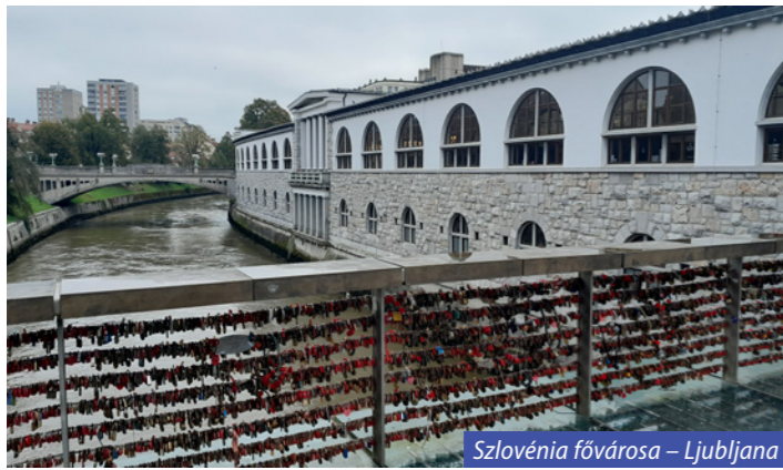
Szlovénia fővárosa – Ljubljana