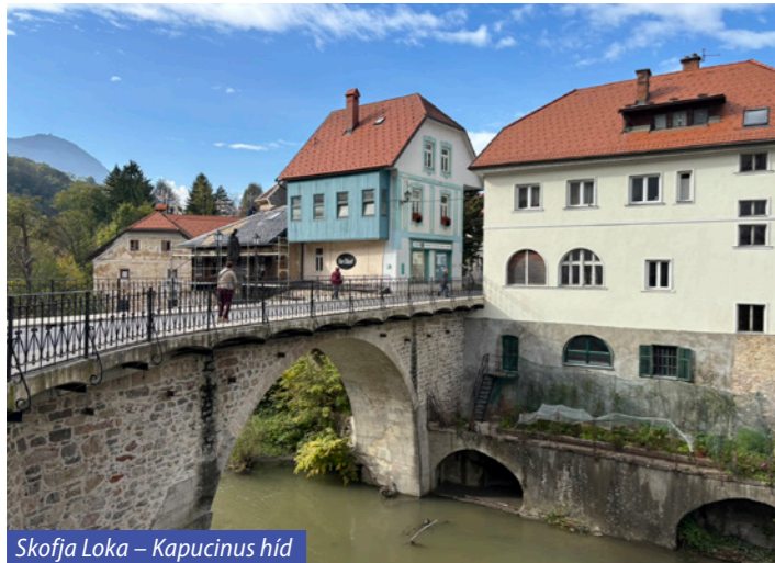
Skofja Loka – Kapucinus híd