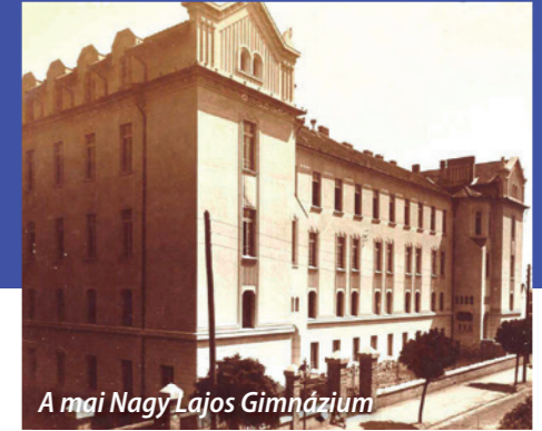
A mai Nagy Lajos Gimnázium