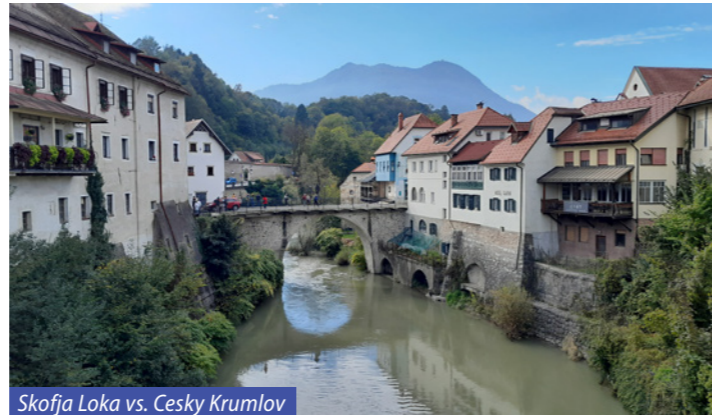
Skofja Loka vs. Cesky Krumlov