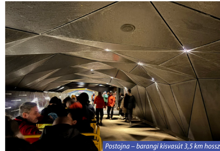
Postojna – barangi kisvasút 3,5 km hosszú