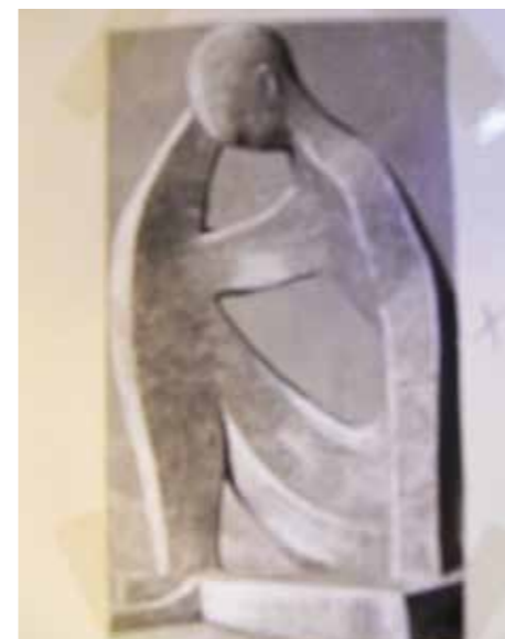
Ülő munkás a Vasép egykori munkásszállója előtt