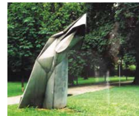
A megcsonkított Zuhatag című fém plasztika