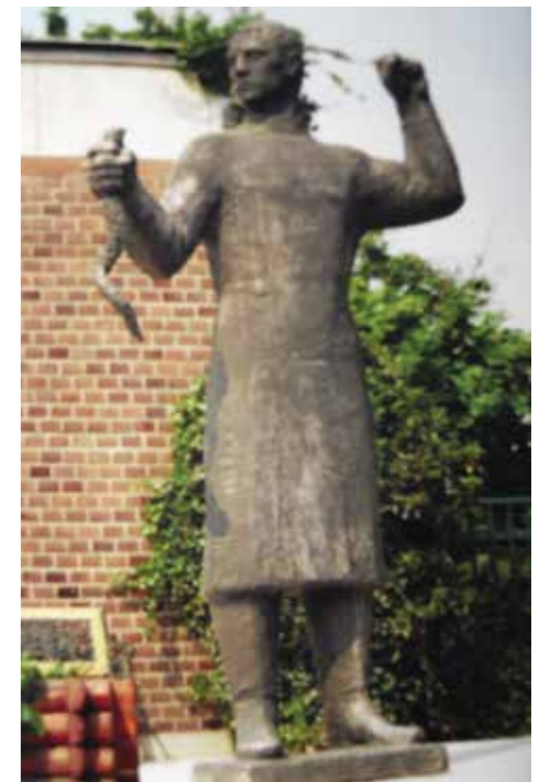
Molnár Jenő Orvos című szobra 1966-ból