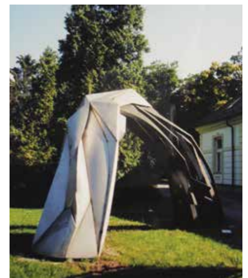
Z.Gács György rongálás előtti fém plasztikája az egykori Brenner-villa mellett