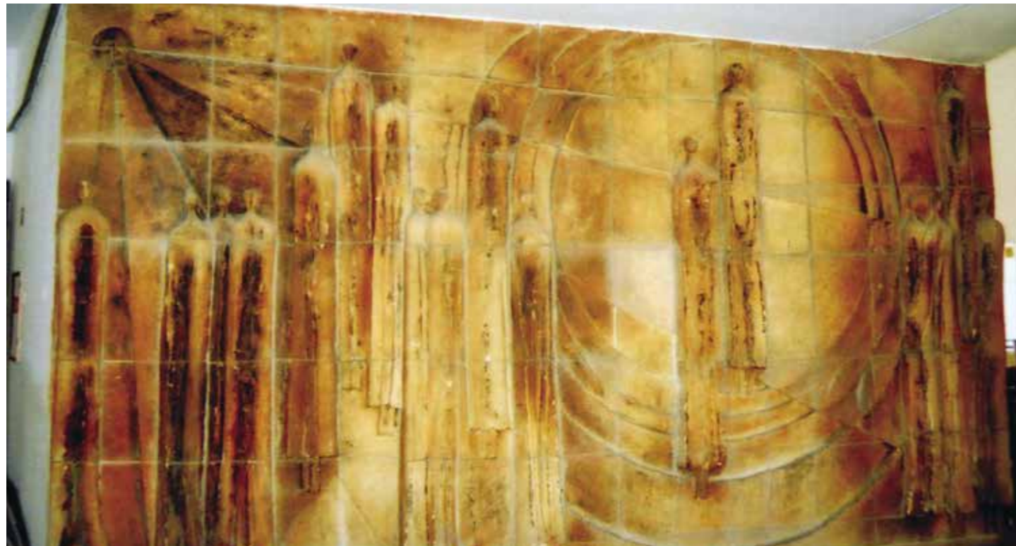
Benkő Ilona Savaria című mázas kerámia falplasztikája 1969-ből

Minden település kulturális arcképéhez, színvonalához hozzátartozik – sok más mellett -, hogy közterületein milyen képzőművészeti alkotások találhatók. Ezek történelmet, ízlést és szemléletet tükröznek, s jó esetben beépülnek polgárai tudatába. Sajnos ezen alkotások közül sok áldozatul esik – (háborút nem számítva) – a politikai változásoknak, a tudatlanságnak vagy a vandalizmusnak, s nemigen hiányolja őket senki, nem emelnek szót pótlásukért.