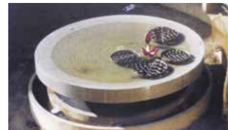
A Domus egykori szökőkútja

rendszerelváltás környékén a privatizáció áldozataként eltűnt. Az egykori „Entzbruder Gimnázium (ma Paragvári Ált. Iskola) bejáratánál áll egy vakolt pillér, amelyen egykor Janáky Viktor üveg és pirogránit elemekből álló színes plasztikája (1974) volt látható, fogadva az érkezőket. Sajnos ezt 2000-ben a sok rongálás és sérülés miatt lebontották, restaurálásra vagy pótlásra nem került sor. Az épületet Tillai Ernő kétszeres Ybl-díjas építész tervezte 1963-ban. A Művelődési és Sportház ugyancsak szegényebb lett egy műalkotással. Ugyanis az emeleten egykor működött az ún. „művész-presszó”, helyet adva