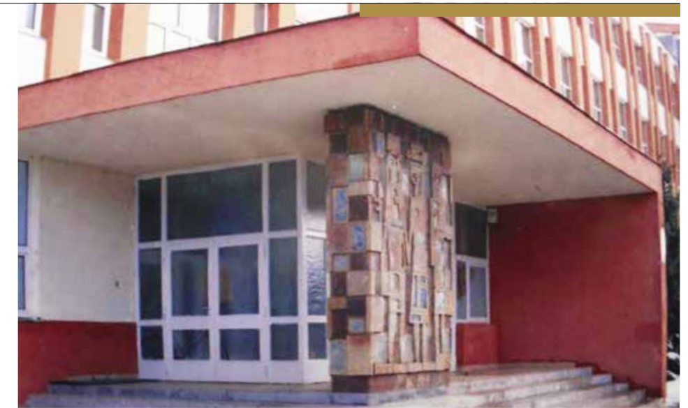
Janáky Viktor kerámiaoszlopa

rendszerelváltás környékén a privatizáció áldozataként eltűnt. Az egykori „Entzbruder Gimnázium (ma Paragvári Ált. Iskola) bejáratánál áll egy vakolt pillér, amelyen egykor Janáky Viktor üveg és pirogránit elemekből álló színes plasztikája (1974) volt látható, fogadva az érkezőket. Sajnos ezt 2000-ben a sok rongálás és sérülés miatt lebontották, restaurálásra vagy pótlásra nem került sor. Az épületet Tillai Ernő kétszeres Ybl-díjas építész tervezte 1963-ban. A Művelődési és Sportház ugyancsak szegényebb lett egy műalkotással. Ugyanis az emeleten egykor működött az ún. „művész-presszó”, helyet adva